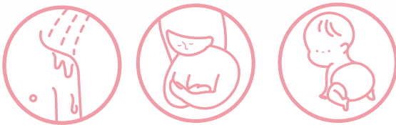
濡れた肌の拭き取り ママの母乳ケア ベビーのオムツ替えシート