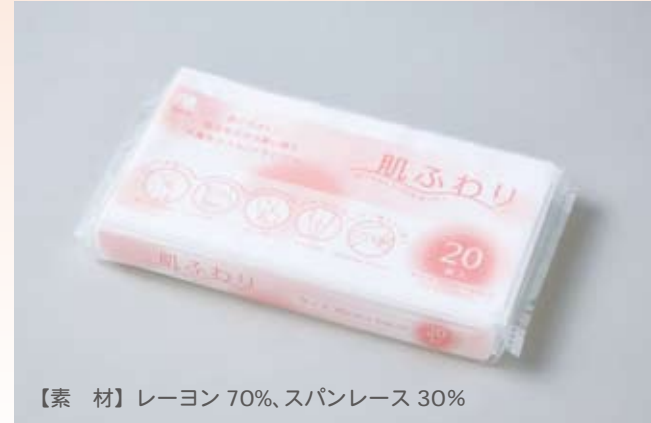
【素 材】レーヨン 70%、スパンレース 30%